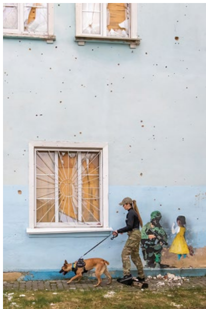
м. Ірпінь, Київська область, Україна квітень 2023 року

Офіцер Весна Лобода та її собака Жужа з кінологічного загону К-9 перевіряють на наявність вибухонебезпечних предметів Центральний будинок культури в Ірпені, визначений ЮНЕСКО як культурний об'єкт. Будівля була уражена російською ракетою 17 березня 2022 року. Протягом першого місяця повномасштабного вторгнення в Ірпені було пошкоджено понад 1 060 будівель, а 115 – зруйновано. Відступаючи, російські війська інтенсивно мінували зайняті ними території, створюючи нові ризики для людей, які намагаються повернутися додому. Малюнок на стіні позаду офіцера Лободи написана Сальваторе Бенінтенде, італійським художником, який залишив серію вуличних малюнків по всій Україні, щоб віддати данину силі та стійкості українського народу. На малюнку зображена маленька дівчинка, яка сварить російського солдата і каже йому, що війна не повинна вестися. М'яка іграшка в її руці уособлює невинність і вкрадене дитинство. Сальваторе назвав цю роботу «Хоробра країна».