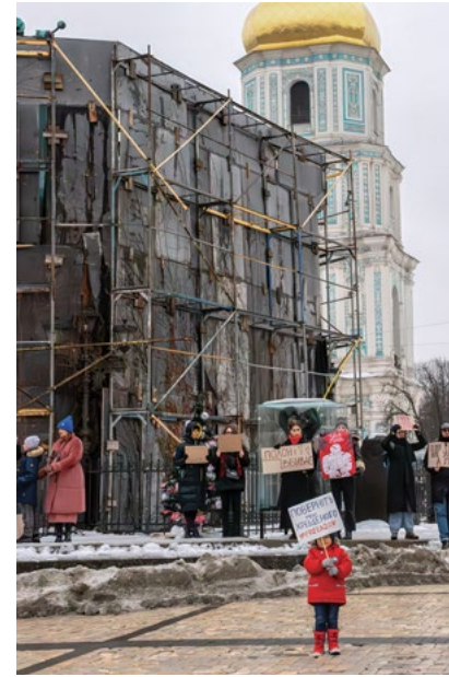
м. Київ, Київська область, Україна грудень 2023 року

Одна з найемоційніших сцен в Україні – це коли солдат прощається з близькими перед тим, як вирушити на поле бою. Залізничний вокзал Краматорська став мішенню масованих обстрілів, зазнавши одного з найсмертоносніших нападів на цивільне населення з початку повномасштабного вторгнення. 08 квітня 2022 року 63 людини загинули, зокрема, дев'ятеро дітей, і понад 150 отримали поранення. У день, коли було зроблено це фото влітку 2023 року, солдати прощалися з родиною, друзями та коханими під безперервні звуки сирен повітряної тривоги. Через тиждень після того, як було зроблено цю фотографію, 27 червня 2023 року, стався ще один напад на ресторан у Краматорську, в результаті якого загинуло 13 людей.