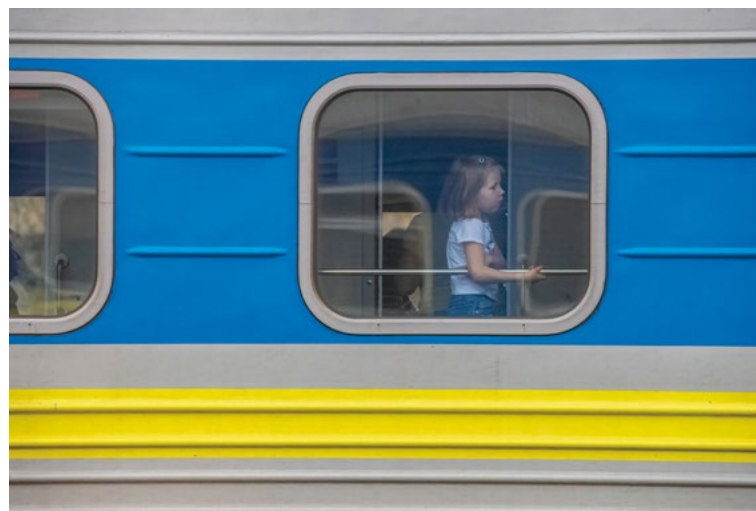
Перемишль, Польща квітень 2023 року

РСЗВ «ГРАД» випускає одну з кількох ракет по російській позиції на окупованій українській території. За лічені хвилини росіяни тріангулюють позицію і відкривають вогонь у відповідь, але ця установка вже переміщується на нову позицію. Система «ГРАД» може випустити 40 ракет протягом 20 секунд. Залежно від моделі, ракети можуть досягати від 20 до 40 кілометрів (12 та 25 миль). Система має нижчі показники точності та купчастості, ніж інші артилерійські системи; однак вона вважається ефективною зброєю для ураження цілей на коротких дистанціях завдяки своїй мобільності, короткому часу попередження про наближення обстрілу та вражаючій силі великого залпу ракет.