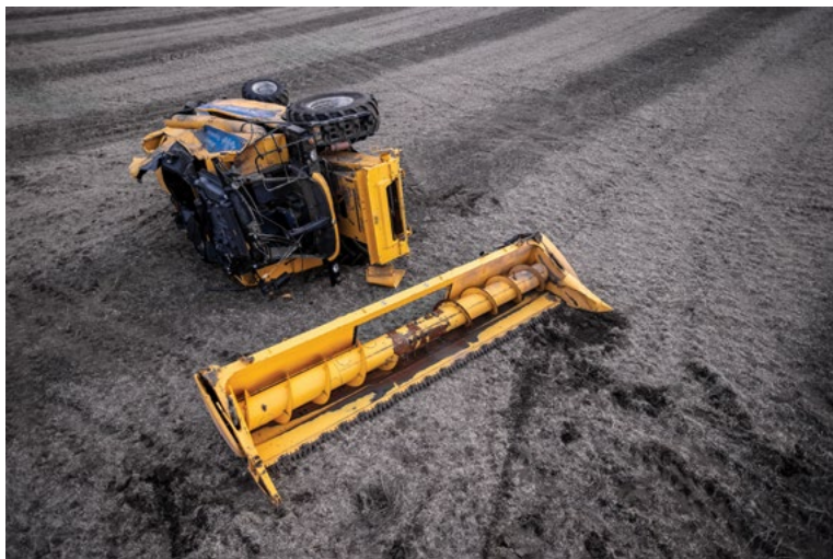
На південний захід від Рівного, Рівненська область, Україна листопад 2024 року

02 липня 2024 року я косив пшеницю на своїй фермі в штаті Іллінойс, коли отримав смс: «Харківська область. Кілька годин тому випущена ракета, знищено комбайн New Holland TC-5.90». Я не міг не думати про те, що через два дні Америка святкуватиме нашу свободу, в той час як українці відчайдушно боротимуться за свою – і все це в той час, коли українські фермери ризикують життям, щоб завершити збір врожаю.