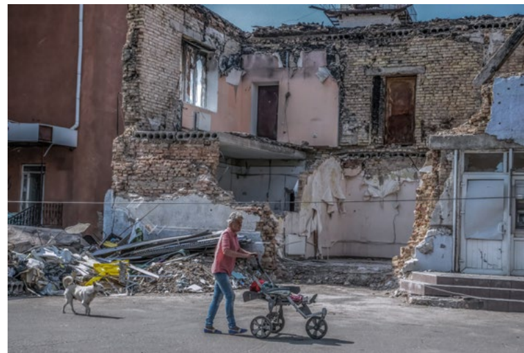
с. Бородянка, Київська область, Україна червень 2022 року

Під час удару цей комбайн знаходився в межах 15 метрів (49 футів) від місця влучання російської ракети С-300. На цьому фото, зробленому через кілька місяців, у листопаді 2024 року, зображено комбайн у тому положенні, в якому він опинився після того, як його перекинуло від вибуху. Комбайн вартістю 140 000 доларів США не підлягає відновленню. За оцінками Світового банку, з 2022 року українські фермери втратили понад 31 мільярд доларів через наземні міни та обстріли, які перешкоджають їм отримати доступ до своїх полів.