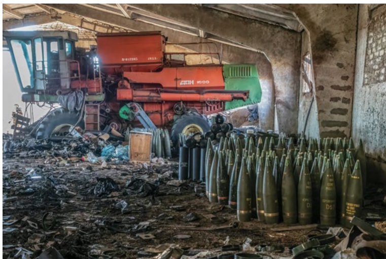
На схід від Лозової, Харківська область, Україна березень-червень 2023 року

Покинута фермерська будівля менш ніж за три кілометри (1,8 милі) від російського наступу забезпечує тимчасове укриття, але воно не триватиме довго, оскільки будь-яке місце вздовж лінії фронту є мішенню. Влітку 2022 року російські війська окупували 22 відсотки сільськогосподарських угідь України, що вплинуло на 28 відсотків озимих і 18 відсотків літніх посівів. Хоча частина цієї території була відвойована, фермерські господарства все ще залишаються полем бою на більшій частині країни. Фотографія зверху зроблена 13 березня 2023 року. Фотографія знизу зроблена через 3 місяці, 14 червня 2023 року. На ній видно залишки будівлі, комбайна та 155 мм снарядів. Будівля була зруйнована російським високоточним боєприпасом «Краснополь» 11 квітня 2023 року. Станом на січень 2025 року ця локація перебувала під російською окупацією.