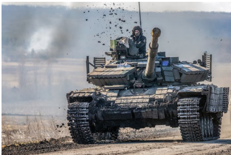
На південь від села Загризове, Харківська область, Україна березень 2023 року

На лінії фронту, лише за кілька кілометрів від російських позицій, український танк Т-72 швидко рухається, щоб його не помітили і не обстріляли. Т-72 – це танк радянських часів, який широко використовується українськими військовими. Він легший за більшість танків, еквівалентних танкам НАТО, але повільніший за багато сучасних танків.