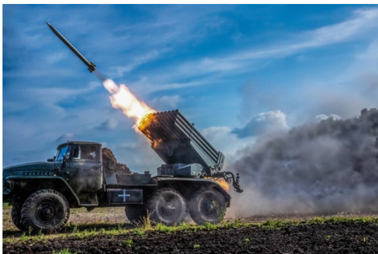
На схід від селища Борова, Харківська область, Україна серпень 2023 року

РСЗВ «ГРАД» випускає одну з кількох ракет по російській позиції на окупованій українській території. За лічені хвилини росіяни тріангулюють позицію і відкривають вогонь у відповідь, але ця установка вже переміщується на нову позицію. Система «ГРАД» може випустити 40 ракет протягом 20 секунд. Залежно від моделі, ракети можуть досягати від 20 до 40 кілометрів (12 та 25 миль). Система має нижчі показники точності та купчастості, ніж інші артилерійські системи; однак вона вважається ефективною зброєю для ураження цілей на коротких дистанціях завдяки своїй мобільності, короткому часу попередження про наближення обстрілу та вражаючій силі великого залпу ракет.