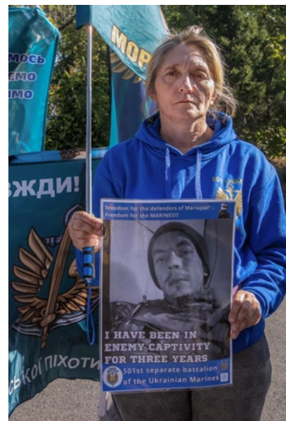
м. Київ, Київська область, Україна вересень 2024 року