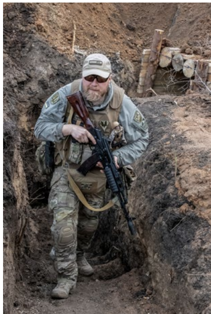
Невідоме місце, Донецька область, Україна квітень 2024 року