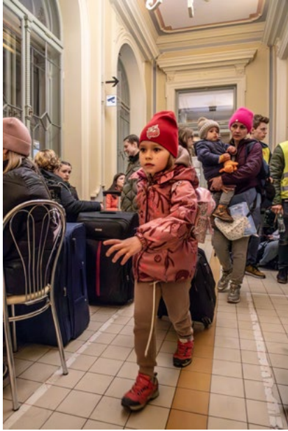
м. Перемишль, Польща квітень 2022 року

У березні 2022 року 50 000 українських біженців щодня прибували потягом до Перемишля, Польща. З того часу деякі сім'ї повернулися додому, в результаті чого загальна кількість перетинів кордону в Україну та з України за перші три роки війни перевищила 48 мільйонів.