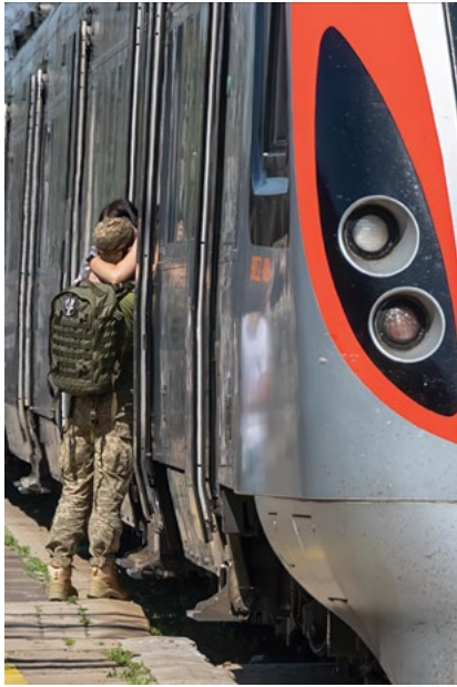
м. Краматорськ, Донецька область, Україна червень 2023 року

Одна з найемоційніших сцен в Україні – це коли солдат прощається з близькими перед тим, як вирушити на поле бою. Залізничний вокзал Краматорська став мішенню масованих обстрілів, зазнавши одного з найсмертоносніших нападів на цивільне населення з початку повномасштабного вторгнення. 08 квітня 2022 року 63 людини загинули, зокрема, дев'ятеро дітей, і понад 150 отримали поранення. У день, коли було зроблено це фото влітку 2023 року, солдати прощалися з родиною, друзями та коханими під безперервні звуки сирен повітряної тривоги. Через тиждень після того, як було зроблено цю фотографію, 27 червня 2023 року, стався ще один напад на ресторан у Краматорську, в результаті якого загинуло 13 людей.