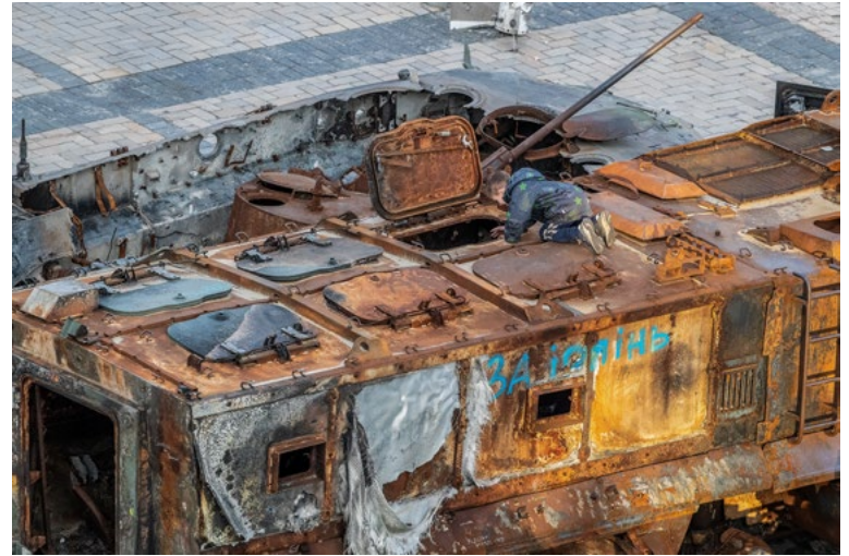
м. Київ, Київська область, Україна квітень 2023 року

Опівночі ця дівчинка мала намір потрапити на потрібний потяг.