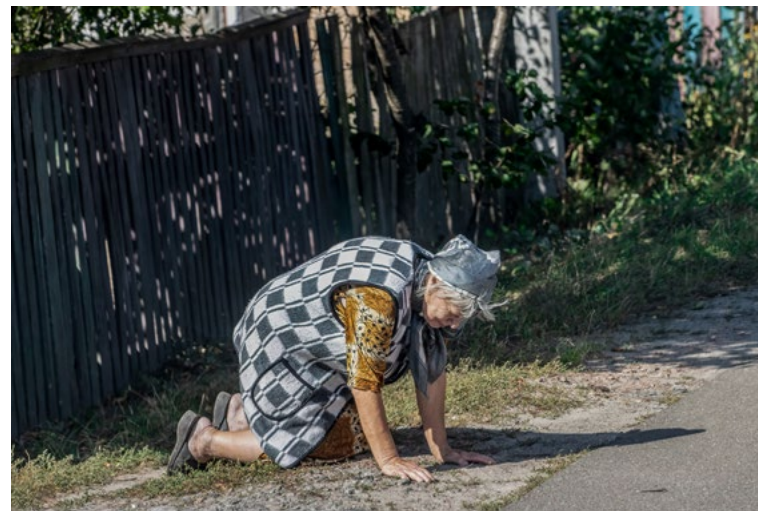
с. Дружня, Київська область, Україна вересень 2024 року

На лінії фронту, лише за кілька кілометрів від російських позицій, український танк Т-72 швидко рухається, щоб його не помітили і не обстріляли. Т-72 – це танк радянських часів, який широко використовується українськими військовими. Він легший за більшість танків, еквівалентних танкам НАТО, але повільніший за багато сучасних танків.